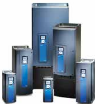
Montaje en pared

Los convertidores de frecuencia VACON® 100 INDUSTRIAL y VACON® 100 FLOW son ideales para ahorrar energía, optimizar el control de sus procesos y mejorar la productividad. Están diseñados para ser multipropósito sin dejar de ser fáciles de manejar. VACON 100 INDUSTRIAL y VACON 100 FLOW son la esencia de lo que hacemos: ofrecer productos innovadores, de gran calidad y fiables para aplicaciones clave de diversos sectores. Aptos para una gran variedad de aplicaciones de par variable y par/potencia constante, como por ejemplo bombas, ventiladores, compresores o cintas transportadoras; casos donde la eficiencia energética y las mejoras de productividad suelen reflejarse en un rápido retorno de la inversión.